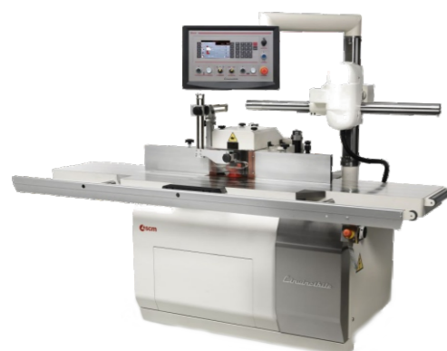
Schwenkbare Tischfräse TI 5 Invincibile