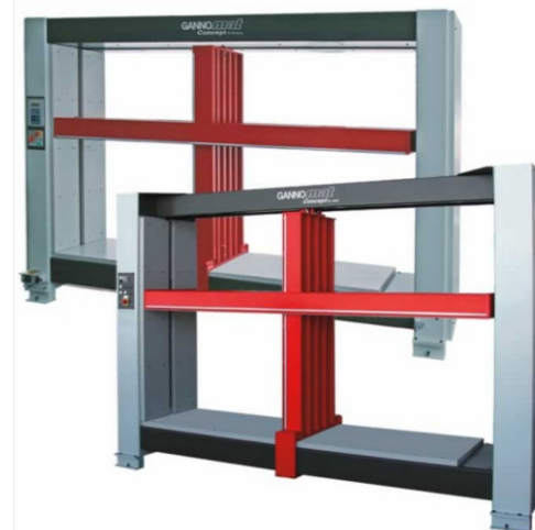
Korpuspresse- Concept ECO