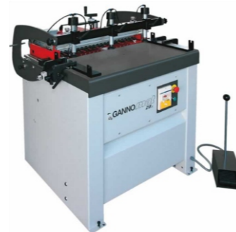
Universal- Bohrmaschine DB 21