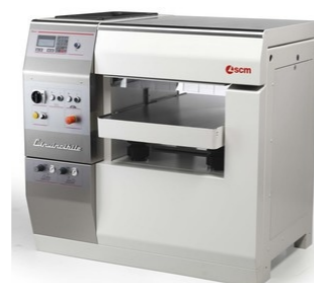
Dickenhobel S 7